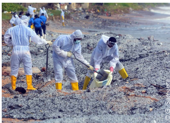
Exemples de ramassage manuel.