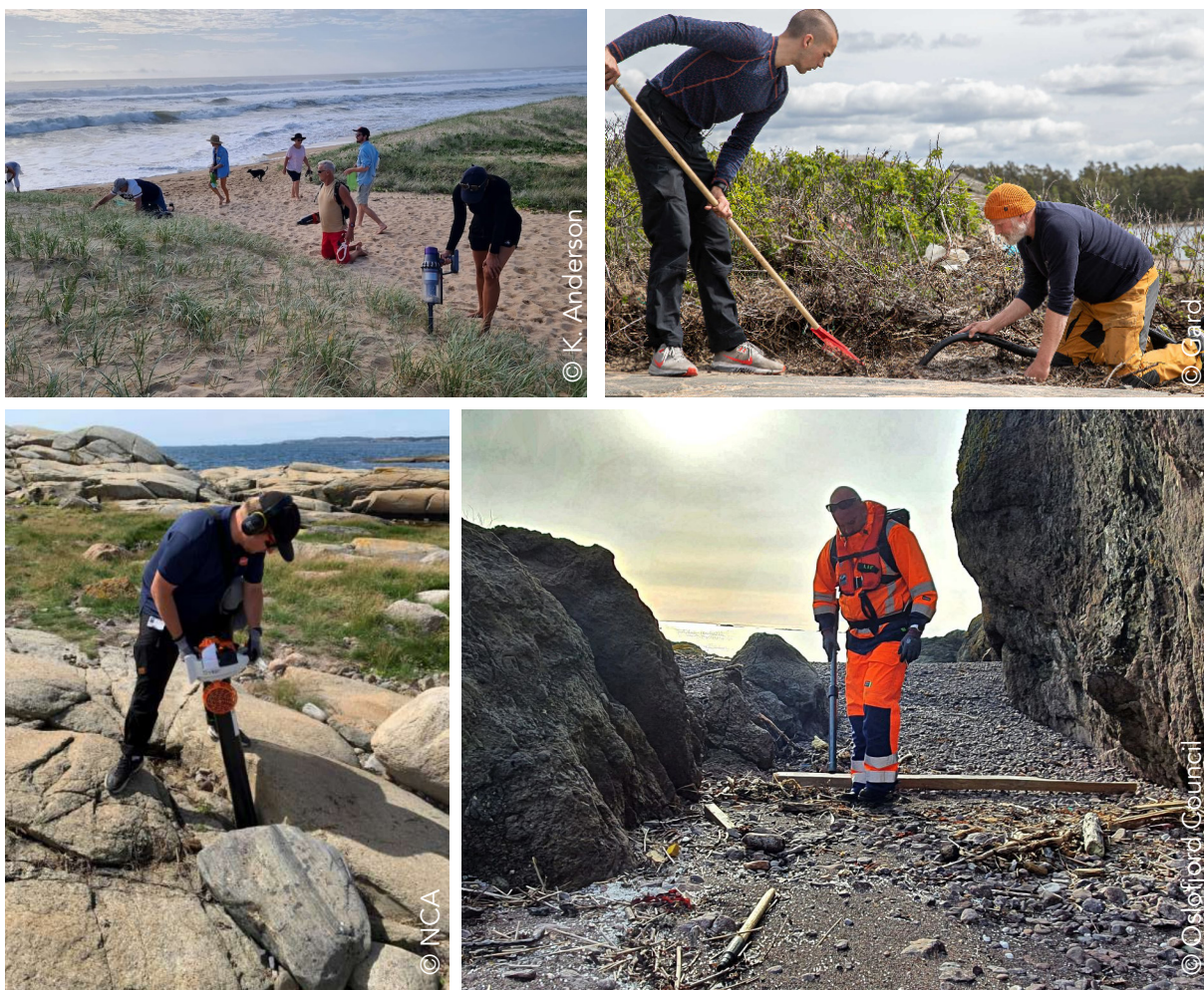
Exemples de récupération par aspiration.

2. La collecte par aspiration : utilisation d'aspirateurs portatifs (e.g. aspirateurs à feuilles, aspirateurs domestiques et industriels) ou de véhicules d'aspiration. Possible sur de nombreux substrats (e.g. plages, zones d'enrochements, zones végétalisées, voiries)