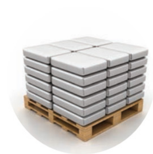
Sacs (25 kg) (1500 kg par palette)

Les GPI sont classés comme « produits non-dangereux » à l'exception des granulés « pré-expansés » qui sont considérés comme « matières dangereuses diverses » (classe 9) pour le transport ferroviaire/routier (ADR/RID), aérien (IATA) et maritime (IMDG) car leur mode de fabrication implique un potentiel rejet de pentane pouvant créer une atmosphère inflammable.