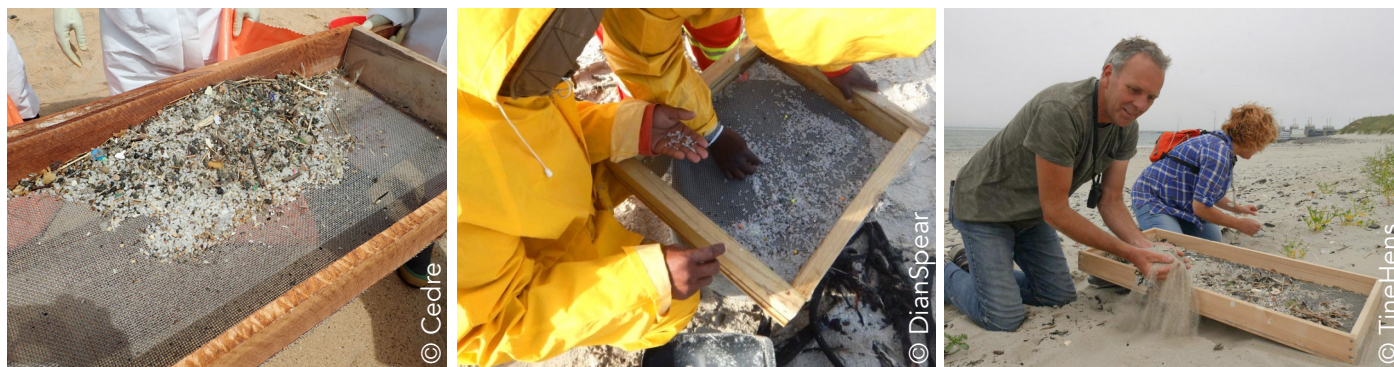
Exemples de récupération par tamisage.

3. Le tamisage : le tamisage est basé sur l'utilisation d'une maille dont la taille est sélectionnée selon la taille des particules que l'on souhaite récupérer dans le « refus de tamisage ». Le tamisage est possible sur différents substrats tels que les sables fins, la terre et les zones de limons et argiles. Cette technique nécessite des adaptations si les GPI se trouvent dans la laisse de mer.