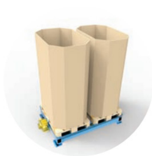
Octabins (500 – 1300 kg)