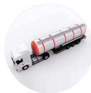
Silos (jusqu'à 35 t)