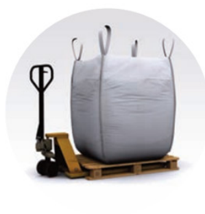
« Big Bag » (500 – 1000 kg)