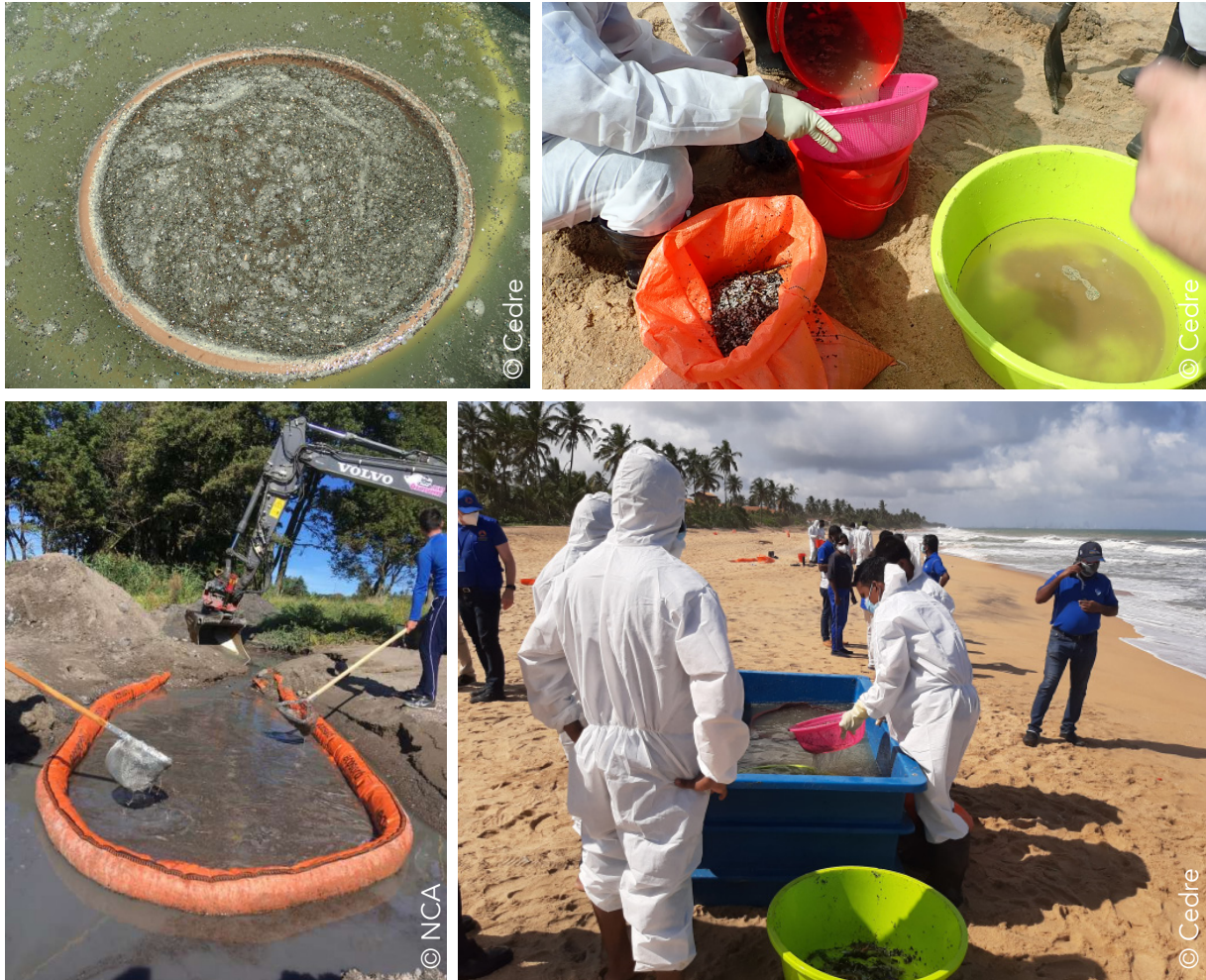
Exemples de récupération à l'aide de la séparation par flottaison.

4. La séparation par flottaison : la séparation par flottaison utilise la différence de densité entre les GPI, l'eau de mer et le sable afin de récupérer les GPI à la surface tandis que le sable coule. Cette technique n'est pas applicable aux GPI présentant une densité supérieure à l'eau. La séparation par flottaison peut être utilisée comme seule technique ou alors comme une méthode complémentaire à une autre technique de récupération (e.g. tamisage, aspiration, récupération manuelle) afin de séparer les GPI des autres matières (e.g. sable, terre graviers). La séparation par flottaison peut se faire à différentes échelles : petite, (e.g. utilisation de seaux), moyenne (e.g. utilisations de poubelles et larges bacs) et grande (e.g. utilisation de fossés, de cours d'eau, installation de bains de flottaison dans le sol ou de piscines).